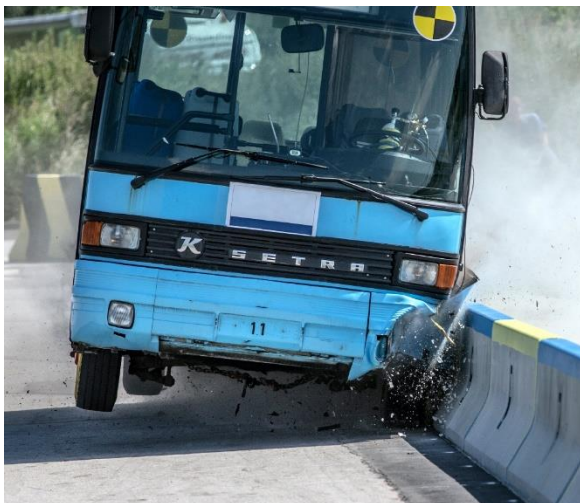
DELTABLOC® har genomfört över 300 krocktester hos certifierade testinstitut. Vid användning av bilden vänligen ange: © KIRCHDORFER Road & Traffic